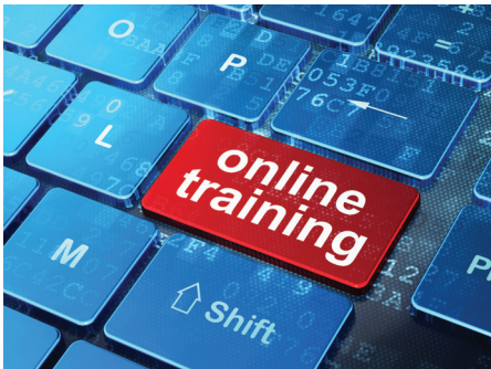
Curso de la OTAN de Sensibilización sobre Generar Integridad.

Los efectos de la corrupción sobre una misión deben tratarse mediante un programa integral de capacitación y educación sobre Generar Integridad. Esto